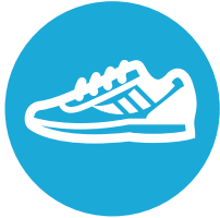
ランニングシューズ